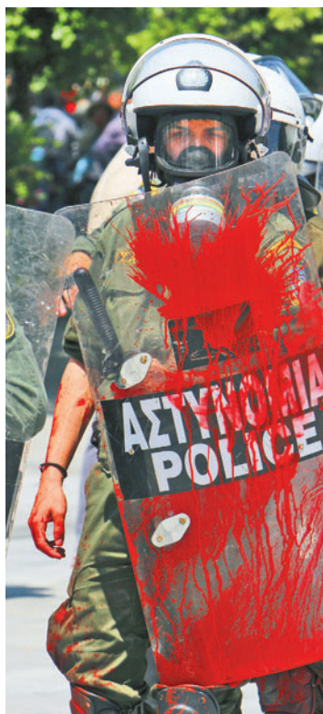
Grecy gwałtownie protestują przeciwko oszczędnościom zapowiadany przez rząd w Atenach

źródło: Eurostat, dane za 2009 rok, fot. AP, rys. RM