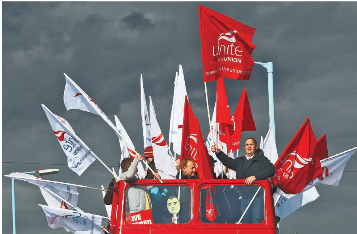
Ludzie myślą, że związkowcy to banda chciwych i skorumpowanych pieczeniary

To powierzchowne myślenie i psucie rynku. Związkowcy długo walczyli o pięciodniowy tydzień pracy. Dlatego nadgodziny powinny być rekompensowane. Związki zawodowe są im potrzebne, bo korporacje to potężny przeciwnik, z którym w pojedynkę nie